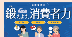
「鍛えよう、消費者力」