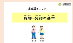
特別支援学校向け 消費者教育用教材